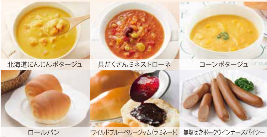
北海道にんじんポタージュ