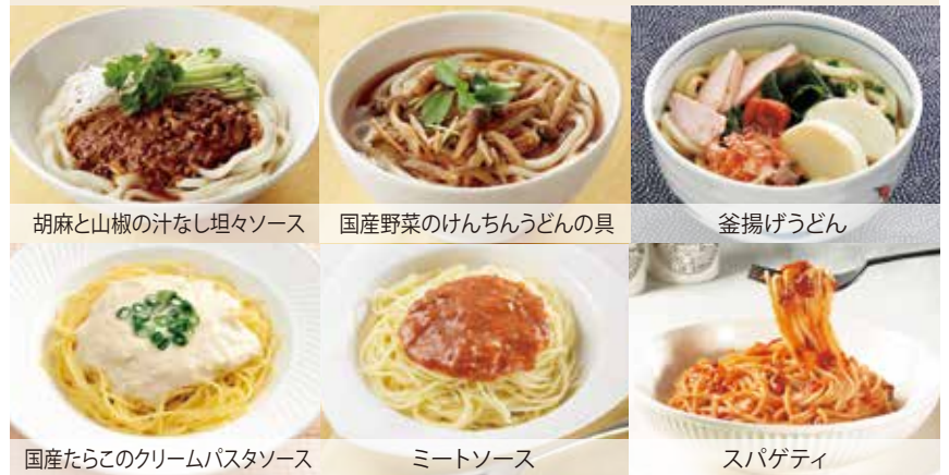
胡麻と山椒の汁なし坦々ソース