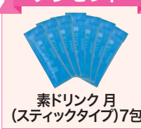
素ドリンク 月 (スティックタイプ)7包