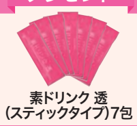
素ドリンク 透 (スティックタイプ)7包