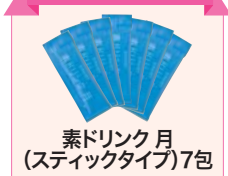
素ドリンク 月 (スティックタイプ)7包