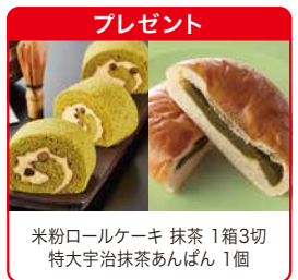
米粉ロールケーキ 抹茶 1箱3切 特大宇治抹茶あんぱん 1個

【セット内容】焼きフライ(ハーブ豚とんかつ)、ビーフハヤシ、タンドリーチキン、北海道産 豚もも肉ベーコン風、フレンチトースト、しるぎーたー、オレンジチョコパン、蒸し鶏のガーリック風味、無塩せきポークウインナー、真だらの味噌漬焼き、秋鮭の塩麹漬焼き、筑前煮、国産たらこのクリームパスタソース、鶏そぼろ入りうの花、チョコゼリーケーキ、ドリームプリンカスタード、スパゲッティ、厚切り山型パン、手造りもちりナン(1枚)、ワイルドブルーベリージャム(2袋)×2、思い出のやさしいミートソース、具だくさんミネストローネ、国産たまごスープ、小松菜のおみそ汁、オムレツ、ひじきの煮物、ほうれん草としめじのおひたし、ほうれん草の和え物、切り干し大根、海苔佃煮、豆ちゃん(大豆の煮豆)、帆立しぐれ煮(小分け)、モーニングケーキ、栗まん(2個)