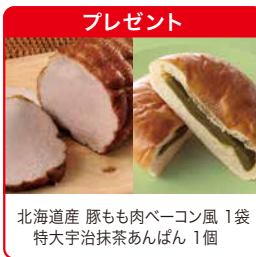
北海道産 豚もも肉ベーコン風 1袋 特大宇治抹茶あんぱん 1個

【セット内容】中華風鶏のうま煮、スパイシーチキン、焼きフライ(一口ヒレカツ)、フレンチトースト、厚切り山型パン、オレンジチョコパン、ノンオイル中華肉ワンタン、ノンオイル中華肉餃子、から揚げ風チキン、ノンオイル中華海老チリソース、八宝菜、南瓜のそぼろ煮、きんぴらごぼう×2、ひじき煮(小分け)、栗まん(2個)、せんべいしょうゆ、メロンパン、らーめん風、ワイルドブルーベリージャム(2袋)、焼豚、小松菜のおみそ汁×2、国産たまごスープ×2、切り干し大根、ほうれん草としめじのおひたし、いんげん豆の煮豆(小分け)×3、味見っ子