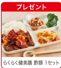
らくらく健康膳 豚豚 1セット

【セット内容】フレンチトースト、厚切り山型パン、しるぎーたー、メロンパン、スパゲッティ、国産たらこのクリームパスタソース、スライスハム、北海道産 豚もも肉ベーコン風、から揚げ風チキン、焼きフライ(コロケ)、からだパランスプレート さばの味噌焼き生姜風味セット、国産鶏のぶっかけ白湯スープ、小松菜のおみそ汁、ひじきの煮物、ほうれん草の和え物、帆立しぐれ煮(小分け)、栗まん(2個)、ドリームプリンカスタード、チョコゼリーケーキ、モーニングケーキ、ワイルドブルーベリージャム(2袋)×2