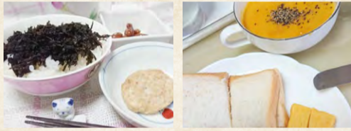
ごはん+トキノのりが瀧本流。パンやスープの種類も豊富。

を丁寧に用意することを自分に言い聞かせています。良くなっている点を見つめていくことで、さらに良い方向へ変わると実感しました。きちんと取り組みれば必ず結果は出ます。自分と向き合う良いチャンスです。皆様にも、明るい未来のために、自分と献立を信じてチャレンジしてほしいです。