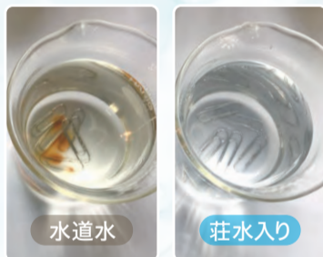
3日後、水道水に入れたクリップは酸化

「水道水」と「荘水入りの水道水」に3日間クリップを放置したところ、水道水に入れたクリップだけが錆び、水質も黄色く変化。荘水入りの水道水には変色が見られませんでした。また、ある地域の水道水を酸化還元電位計（電位大→酸化力が強い、電位小→還元力が強い）で測ったら440mVでしたが、荘水を入れた5分後には339mVまで低下。水の酸化を防ぎ、還元力を強めたことから、荘水には抗酸化力が備わっていることが分かります。