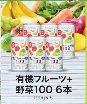
有機フルーツ+ 野菜100 6本 190g×6