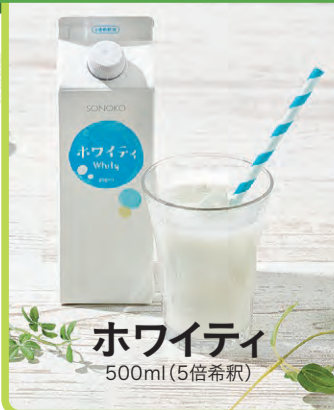
ホワイトィ 500ml(5倍希釈)