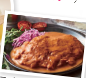
スパイシーチキン