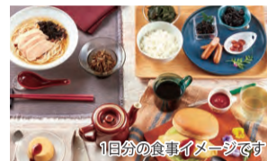
1日分の食事イメージです

【セット内容】蒸し鶏のガーリック風味、国産肉100%直火焼きハンバーグ、特製つゆ仕込みの国産牛すき丼、無塩せきポークウインナー スパイシー、スライスハム、秋鮭の塩麹漬け焼き、思い出のやさしいミートソース、ビーフシチュー、極みレーズンパン、極みロールパン2個×3、極み粒あんぱん、極みカレーパン、極みチョコチップパン、バーガーパン×2、らーめん風、スパゲッティ、具だくさんミネストローネ、北海道にんじんポタージュ、ほくほくポテトのクリームシチュー、国産小松菜のみそ汁、手焼きオムレツ、2種のすり身の無リンかまぼこ、きんぴらごぼう、南瓜のそぼろ煮、ほうれん草の和え物、切り干し大根、鶏そぼろ入りうの花×2、ひじき煮、北海道産小豆のゆであずき、ドリームプリン カスタード、栗まん(2個)、モーニングケーキ、フルーツゼリー温州みかん