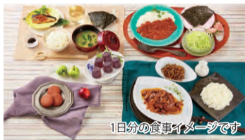
1日分の食事イメージです