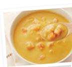
北海道にんじん ポタージュ