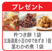
プレゼント 杣つき餅 1袋 北海道産小豆のゆであずき 1個 茎わかめ煮 1袋

ご用意いただくもの:ごはん(ごはんなしセットのみ)/キャベツ/和風ノンオイルドレッシングなどの調味料、スパイス