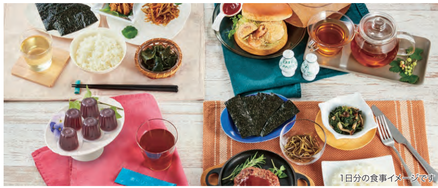
1日分の食事イメージです