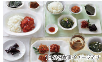
1日分の食事イメージです

【セット内容】越後もちぎたのハンバーグ〜トマト煮込み〜、特製つゆ仕込みの国産牛すき丼、スライスハム、秋鮭の塩麹漬け焼き、国産真いわしのしょうが煮、クリームカレー、ポークカレー、思い出のやさしいミートソース、ノンオイル中華 中華丼、極みレーズンパン、極み粒あんぱん、極みチョコチップパン、らーめん風、スパゲッティ、2種のすり身の無リンかまぼこ、きんぴらごぼう、ほうれん草としめじのおひたし、ほうれん草の和え物×2、しらす煮、いんげん豆の煮豆(小分け)×2、国産小松菜のみそ汁、乾わかめ、ひじき煮、昆布水のもと、豆ちゃん(大豆の煮豆)、板のり、栗まん(2個)×2、フルーツゼリー温州みかん、黒蜜風味ようかん(12本)