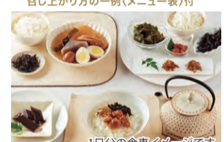
1日分の食事イメージです

【セット内容】じゃがいもゴロゴロカレー、だし薫るかき玉風親子丼、ビーフシチュー、だしが美味しいおでん、特製つゆ仕込みの国産牛すき丼、まぐろ煮みそ味、かつを煮、帆立しぐれ煮、節味楽、いんげん豆の煮豆、茎わかめ煮、フルーツゼリー温州みかん、黒蜜風味ようかん(12本)