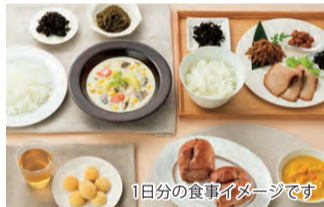
1日分の食事イメージです

【セット内容】特製つゆ仕込みの国産牛すき丼、鶏肉のやわらか煮〜オレンジ風味〜、国産肉100%照り焼きソースハンバーグ、豚肉のシャリアピン、焼豚、無塩せきポークウインナー ハーブ、国産真さばの味噌煮、秋鮭の塩麹漬け焼き、真グコとエビの黄身酢和え、国産小松菜のみそ汁、北海道にんじんポタージュ、ほくほくポテトのクリームシチュー、極みカレーパン、極み粒あんぱん、極みチョコチップパン、釜揚げうどん、ひじきの煮物、きんぴらごぼう×2、ほうれん草としめじのおひたし、ほうれん草の和え物、小松菜のおひたし×2、南瓜のそぼろ煮、鶏そぼろ入りうの花×2、ひじき煮(小分け)、いんげん豆の煮豆(小分け)、昆布水のもと、豆ちゃん(大豆の煮豆)、2種のすり身の無リンかまぼこ、トキノ海苔の佃煮、板のり、モーニングスイッチスムージー キング(いちご&トマト)、黒豆塩大福(4個)、カシューナッツクッキー、素ドリンク 月(スティックタイプ×1包)×7