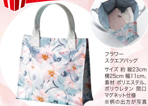
フラワー スクエアバッグ

サイズ 約 縦23cm 横25cm 幅11cm、素材 ポリエステル、ポリウレタン 間口マグネット仕様 ※柄の出方が写真と異なる場合があります。