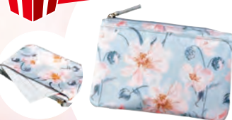
ザ・ソノコ ホワイトニング エッセンス 4.5mL